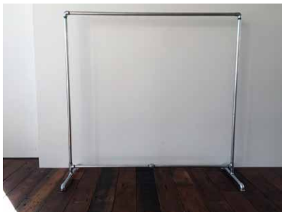
ハンガーラック 15本 W1500 x H1530mm