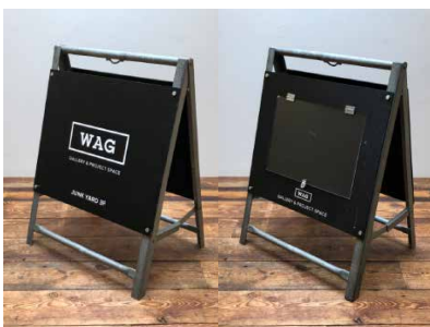
A型看板 A3ヨコの紙が片面に入ります。