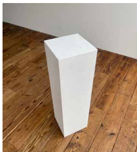
ディスプレイボックス(小 2個) W250 x D250 x H870mm