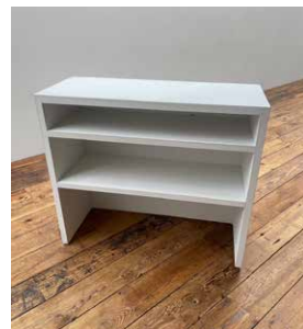
カウンター W800 x D320 x H870mm