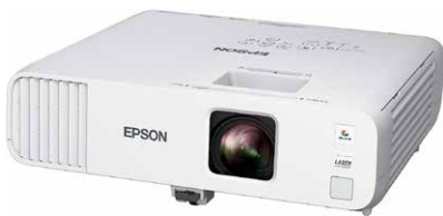
■プロジェクター(有料) EPSON EB-L250F ※プロジェクターは1万円/日にてレンタル可能です。