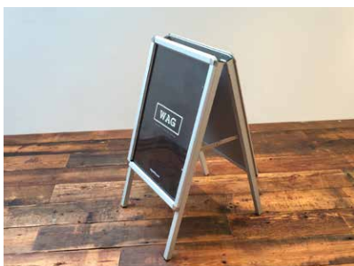
A型看板 A2タテの紙が両面に入ります。