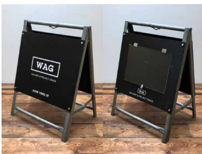
A型看板 A3ヨコの紙が片面に入ります。