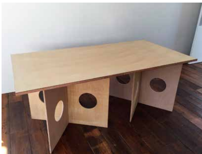
テーブル 2台 W1800 x D900mm x H745