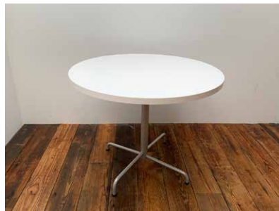
丸テーブル 5台 φ900mm x H720