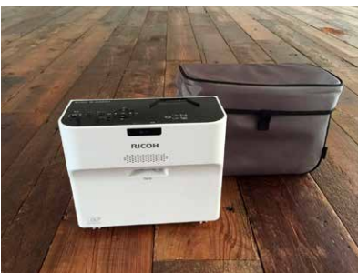
■超短焦点プロジェクター(有料) RICOH PJ WX4141 Mini D-SUB15、HDMI ※プロジェクターは1万円/日にてレンタル可能です。