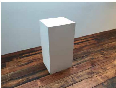
ディスプレイボックス (大)W450 x D400mm x H870