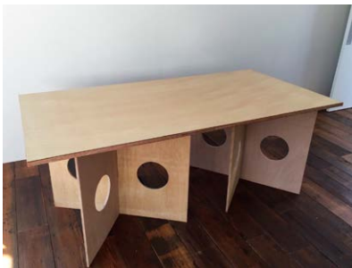
テーブル 2台 W1800 x D900mm x H745