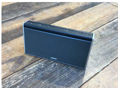
BOSE SoundLink Bluetoothスピーカー