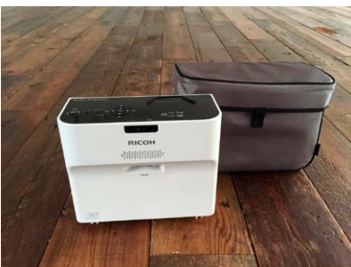
■超短焦点プロジェクター(有料) RICOH PJ WX4141 Mini D-SUB15、HDMI ※プロジェクターは1万円/日にてレンタル可能です。