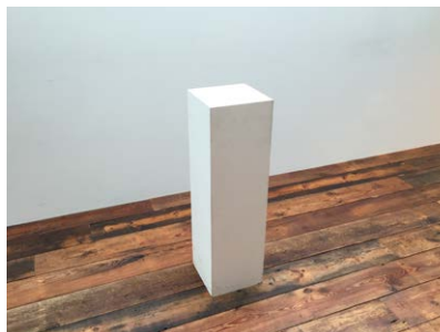
ディスプレイボックス (小)W250 x D250mm x H870