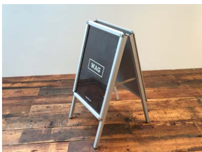
A型看板 A2タテの紙が両面に入ります。