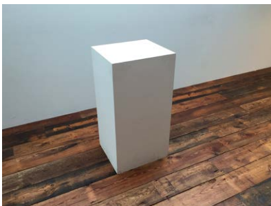
ディスプレイボックス (大)W450 x D400mm x H870