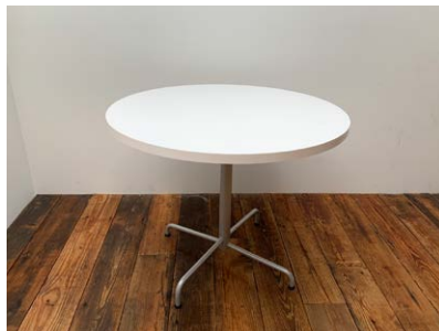
丸テーブル 5台 φ900mm x H720