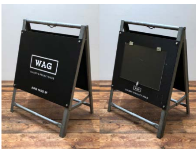
A型看板 A3ヨコの紙が片面に入ります。