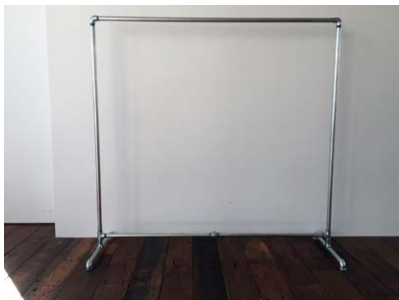
ハンガーラック 15本 W1500 x H1530mm